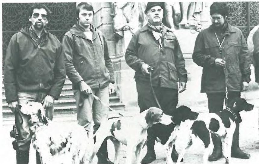
De danske deltagere.