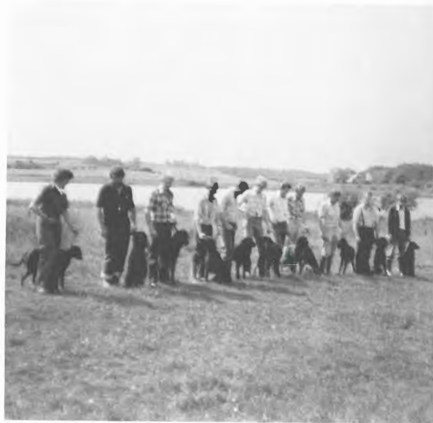
Deltagere ved apporteringsprøven i Jylland har stillet hundene op til skue.

Klubben legger stor vekt på den direkte samarbeidsavtalen med NKK, og vil i kommende diskusjoner om organisasjonsmønsteret stå fast på at slik direkte avtale mellom spesialklubb og kennelklubb opprettholdes.