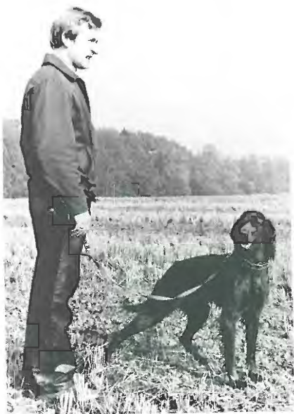
Canel med sin stolte ejer.