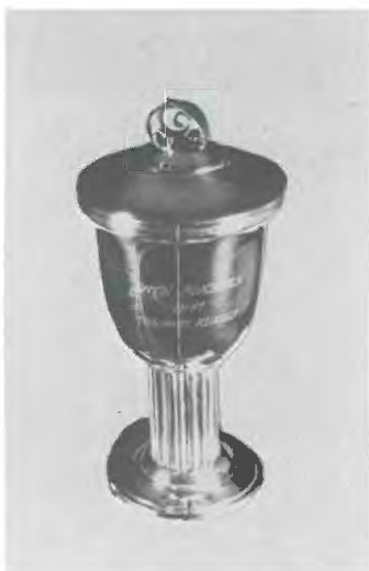
Ærtepokalerne. Skænket af Ærteklubben.

Ærtepokalen. F.J.D.s sjællandske prøve unghundeklasse.