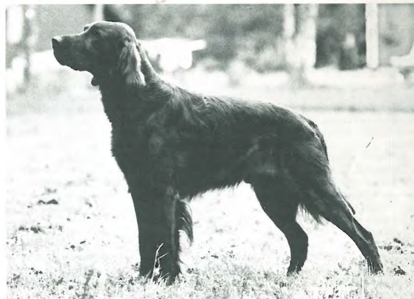
Pelé, äg. Thure Ohlsson.