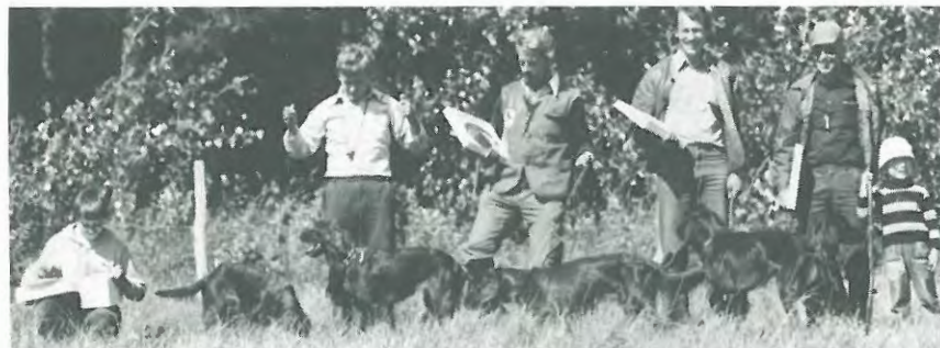
De præmietagende hunde med deres stolte ejere.