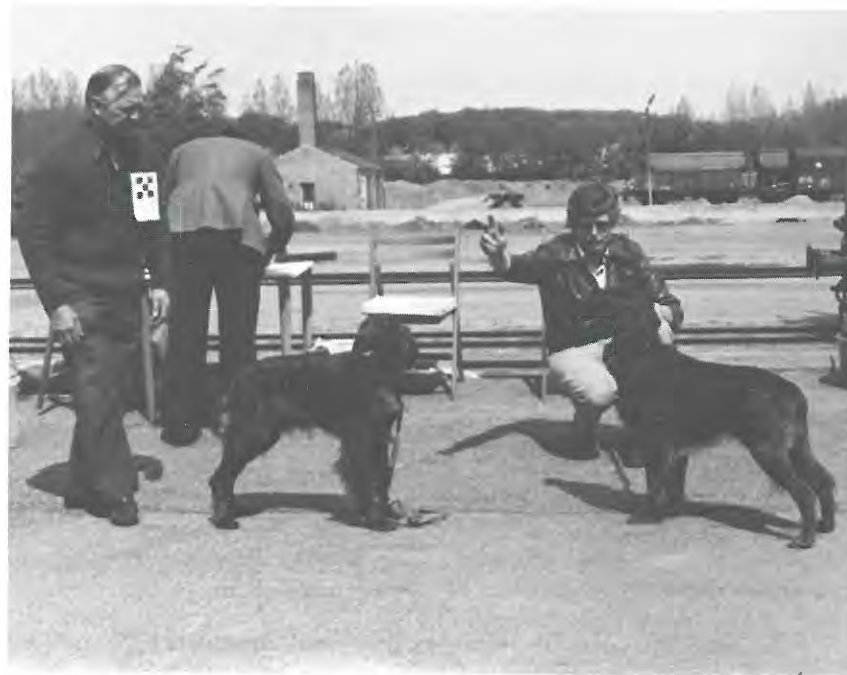
BIR nr. 1 og 2 FJD udstilling i Odense.