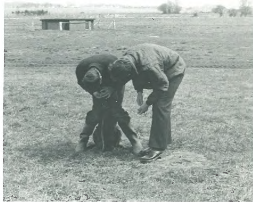
Tandvisningens svære kunst.