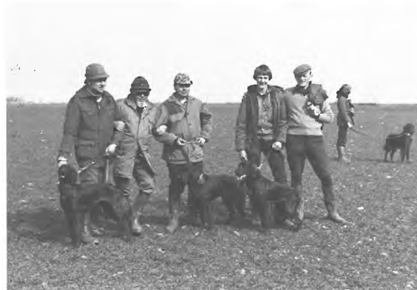
Dommerne med deres præmietagende hunde.