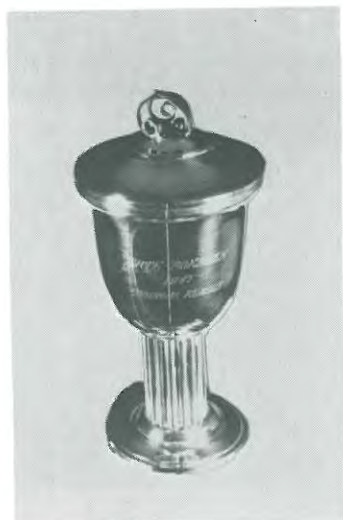
Ærtepokalerne. Skænket af Ærteklubben.