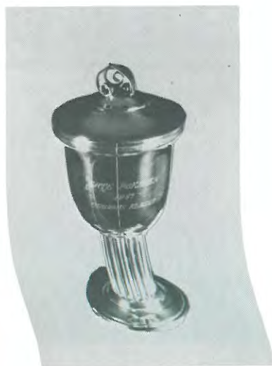
Ærtepokalerne. Skænket af Ærteklubben.