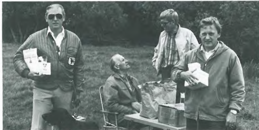
Dommer og prøveleder samt de stolte ejere af pokalvinderne.