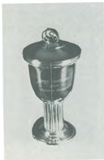
Ærtepokalerne. Skænket af Ærteklubben.