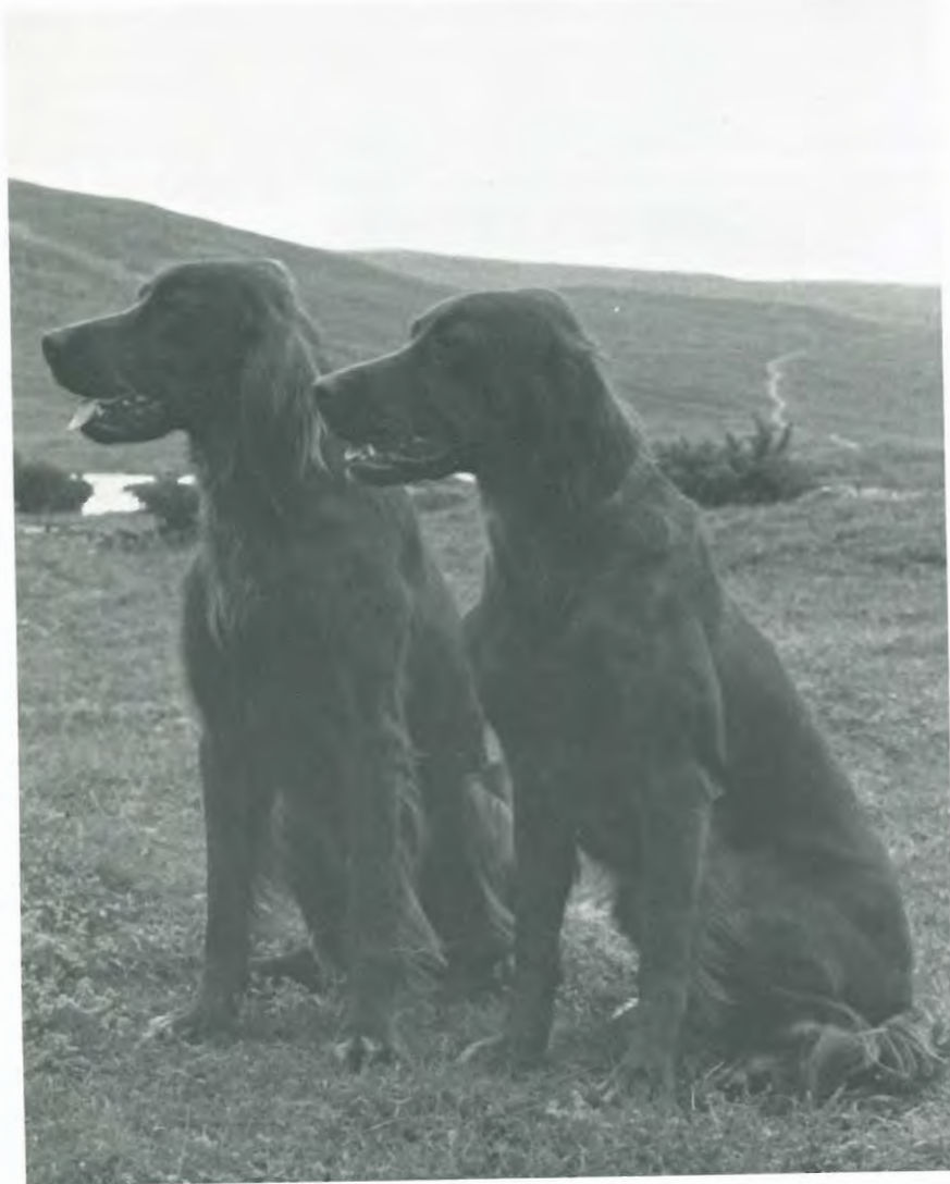
Kullsøsken Vestmarkas Red Lady og Vestmarkas Fly fotografert 1981 på «Vinstebu» av Ellen Høiness.