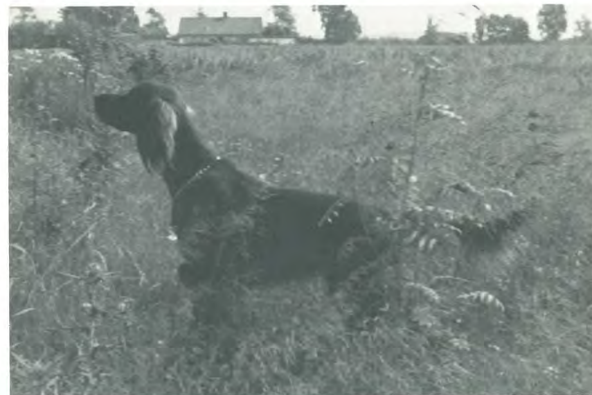
Smut i stand, ejer: E. Bonde.