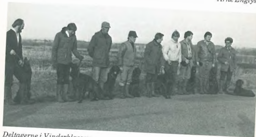
Deltagerne i Vinderklassen.