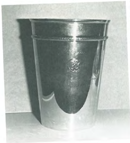
Pokal til bedst placerede hanhund på FJD's vinderklasse. Pokal skænket af Anders Sofus Sørensens enke. Pokalen skal vindes 2 gange i træk eller 3 gange i alt, for at blive ejendom.