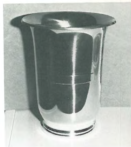
Pokal til bedst placerede hanhund på DISK's hovedprøve i vinderklasse Pokal skænket af Agner Christensen. Pokalen skal – for at blive ejendom – vindes 2 på hinanden følgende år eller tre gange i alt med 2 forskellige hunde. Hunden (hundene skal have mindst 2. pr. på udstilling).