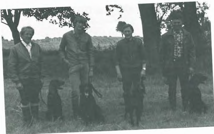
DISK's deltagere på settermatchen.