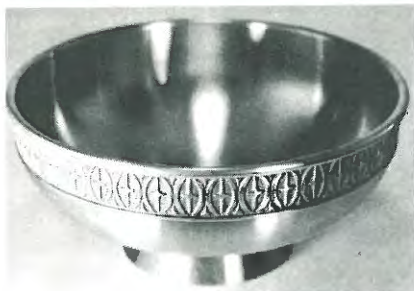
Opdrætter Cup, udsat af Jubilæumsfonden 1981.