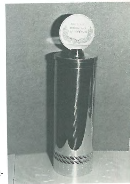
Andelsbankens ærespokal tildeles bedst placerede hund i ungdomsvinderklassen 1982.