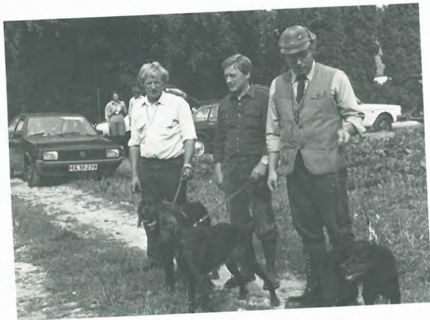
De 3 placerede.

Gordon setterne vandt altså for 3. år i træk matchen.