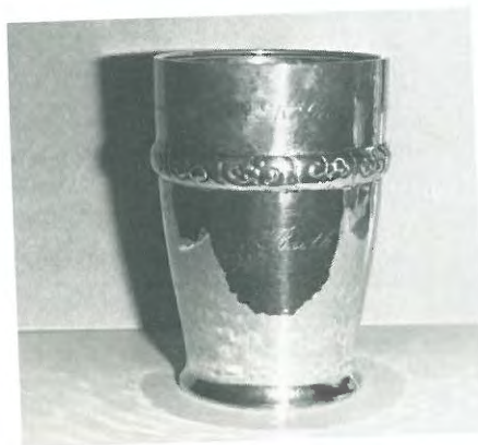
Pokal til bedst placerede tæve på FJD's vinderkl. Pokal skænket af Anders Sofus Sørensens enke. Pokalen skal vindes 2 gange i træk eller 3 gange i alt, for at blive ejendom.