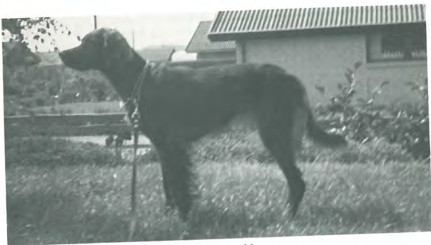
Bonnie, som vandt både åben kl. og Vinder kl.