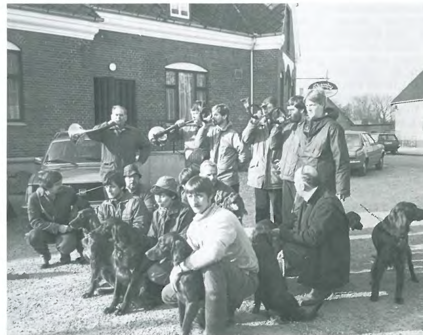
Inden afgang til terrænet, fanfare for den irske setter.