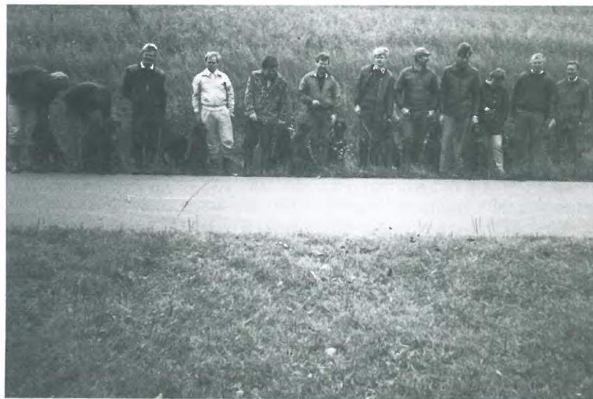
De fleste af deltagerne fra Den jyske apporteringsprøve.