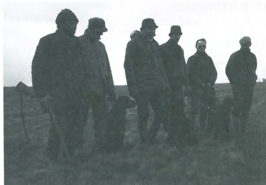
Fra vinderklassen flankeret af skytte og dommer.