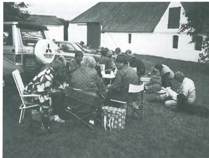
En hyggelig snak over en øl + snaps + brød og sild.