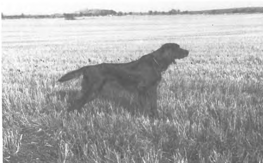
Starlight i smuk stand.