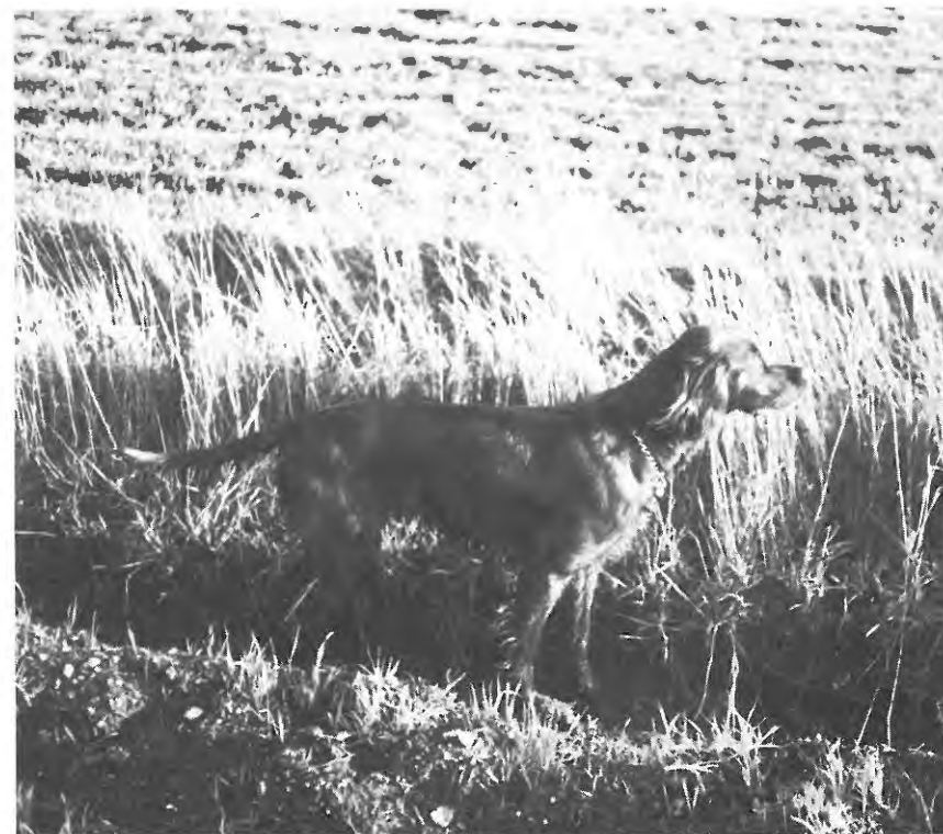
Rosty i stand.