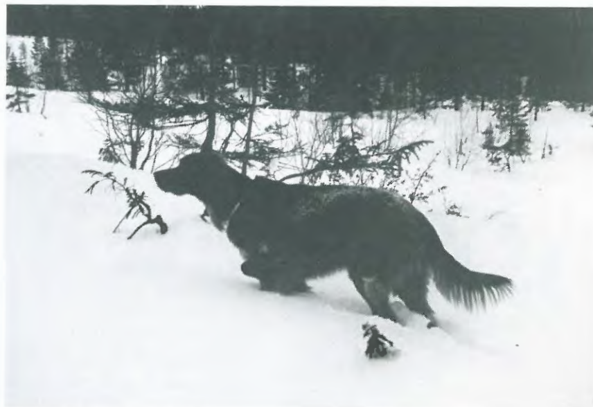
NUJCH Steinfossens Balder.

3 × 3AK Skogsfugl/høyfjell/lavlandsprøve