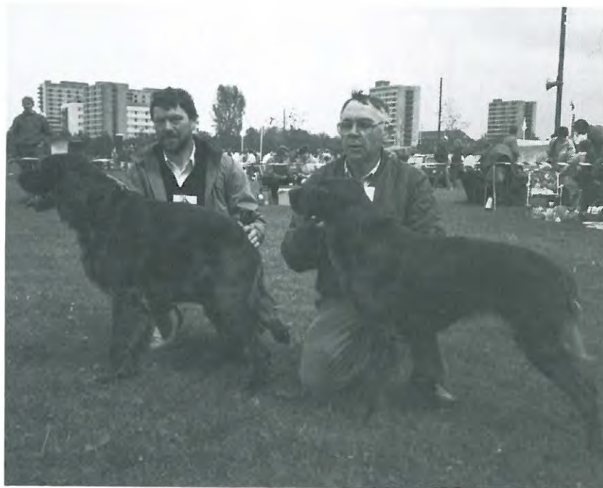
Fra venstre: 1. vinder Åben kl. hanner, 1. vinder Åben kl. tæver.