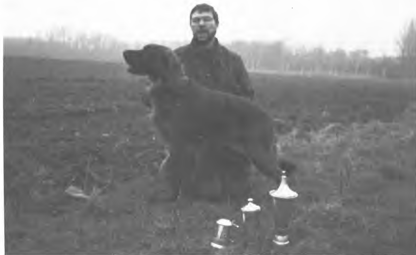
Casper med sin stolte ejer.