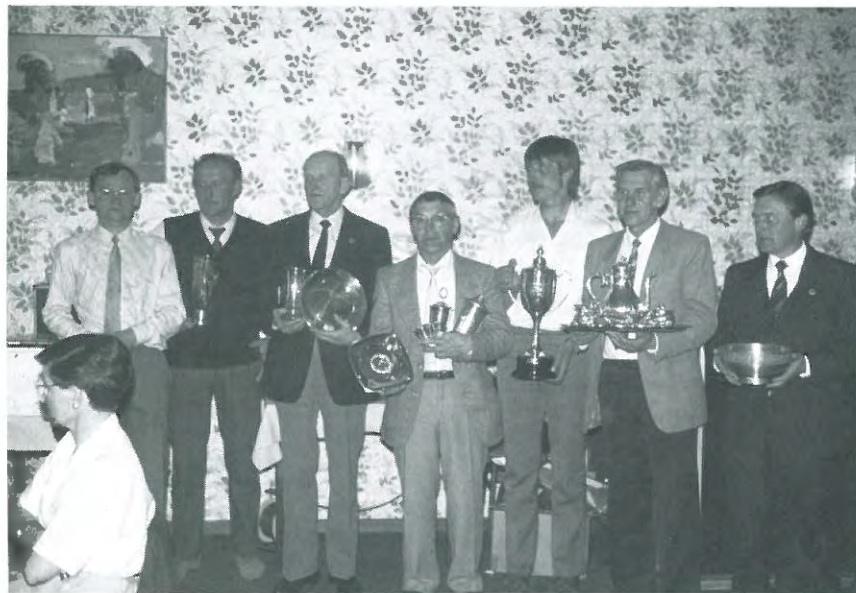
Ved overrækkelsen af DISK's pokaler.