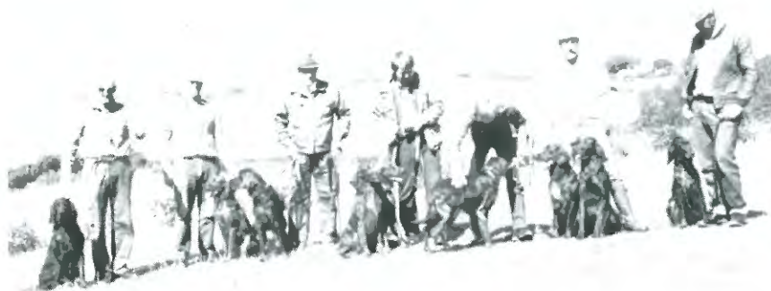
Deltagerne fra Den fynske apporneringsprøve.