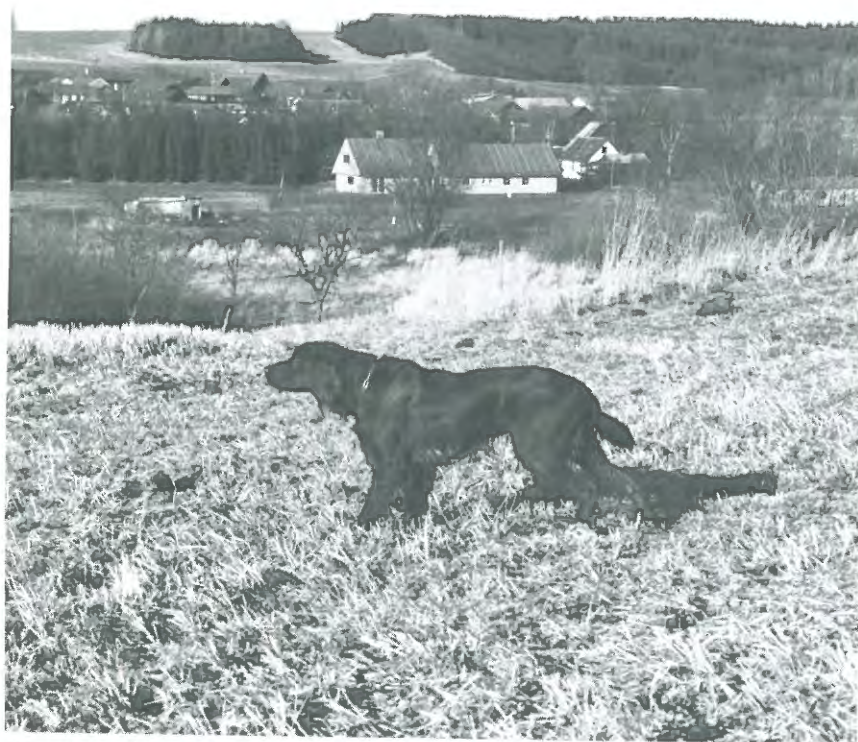
Thor i stand.