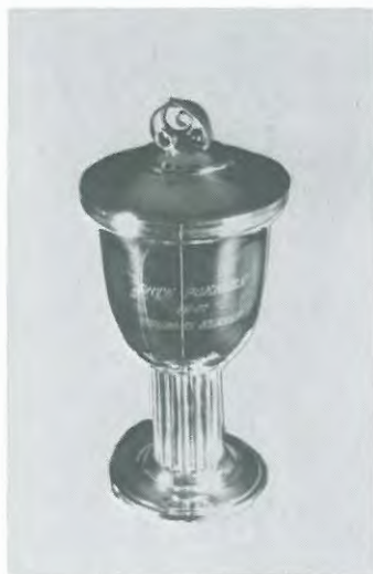
Ærtepolakerne. Skænket af Ærteklubben.