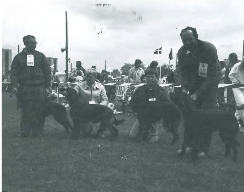
Fra venstre: Rækkefølgen i Åben kl. tæver.