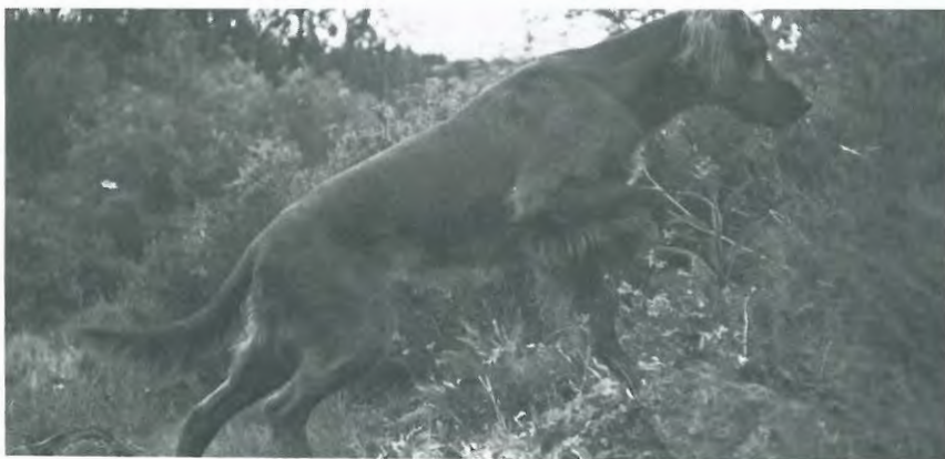
NUJCH Angledalens Aida.

5 × 1VK (herav en gang CK og en gang CACIT)