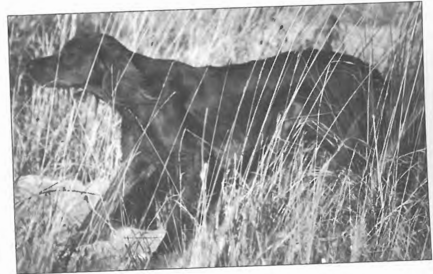
Årets svenske irsksetter Östrabys Amy.

Över till årets besvikelse – unghundarna. Vi tyckte väl i förväg att det gjorts flera intressanta kombinationer men på jaktproven ville det sig inte. Det kan vara tillfälligheter men det kan även vara en indikation på att vi kommit in på