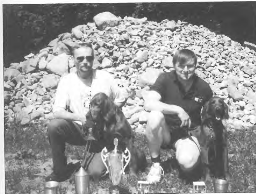
Den fynske apporteringsprøve. Vinder Åben klasse: Zita. Vinder Unghunde-klasse: Dina.