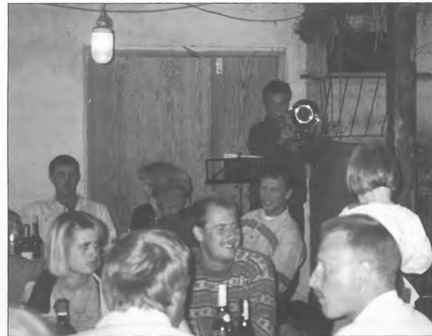
Bal i Farsø.