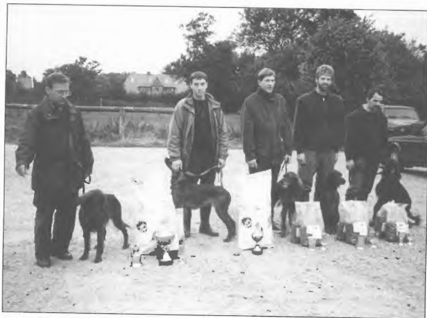
De placerede hunde.