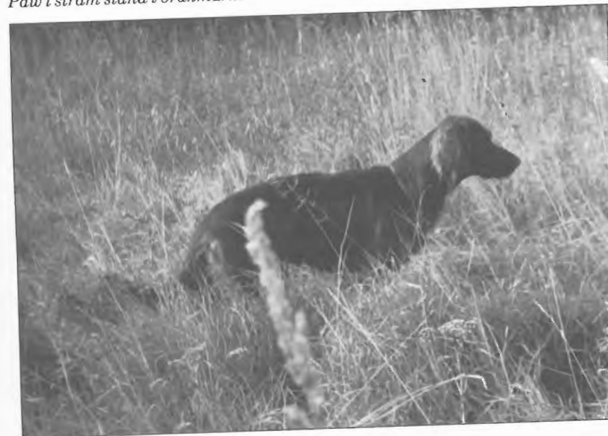
Paw i stram stand i brakmark.