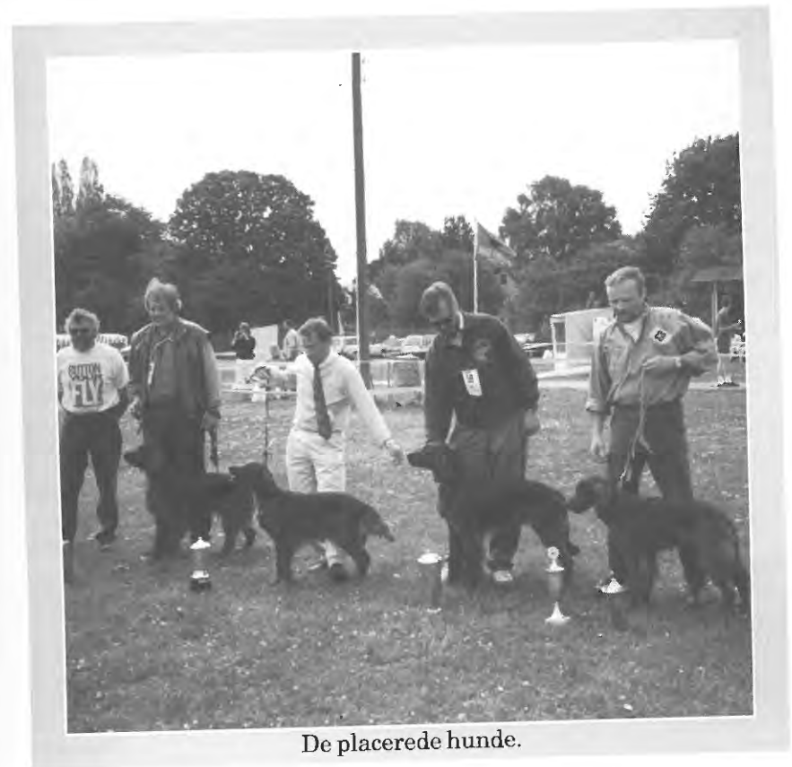
De placerede hunde.