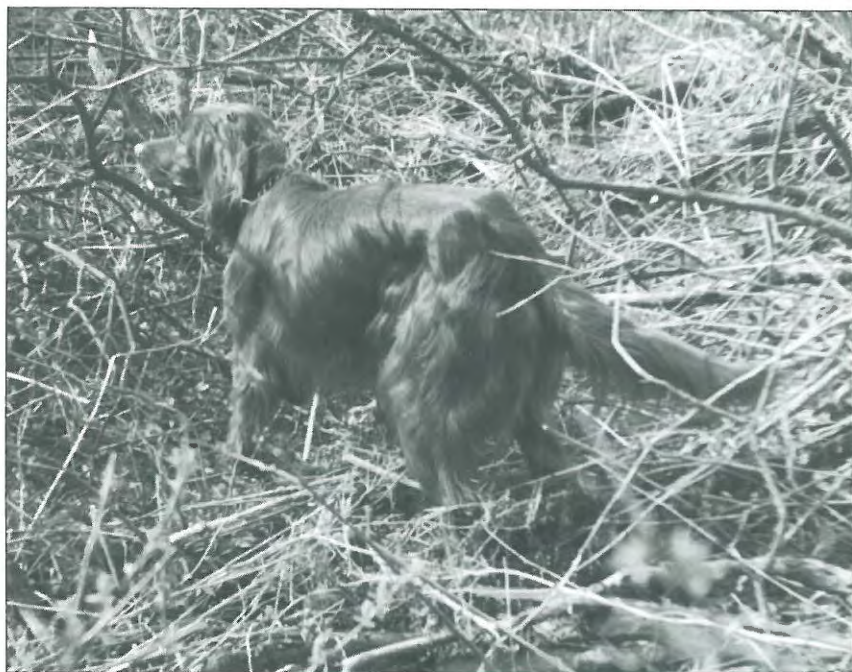
Eldo 15417/87, rød, f. 10.6.87. Ejer: Helge Knudsen, Søvej 13, 5792 Årslev.