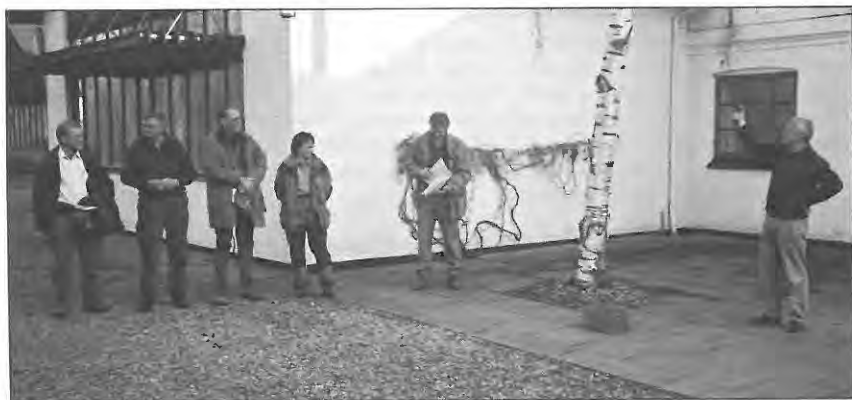
Vinderklassen skydes ind.

Klippeøens Sip anlægger et søg med gode udslag på vintersædmark, men den bruger også en del tid bag levende hegn og på nabomark. Farten er acceptabel, galopaktionen kunne ønskes lidt mere flydende og ubesværet, stilen er god, og der er god kontakt til fører. Der påvises ikke fugl i slippet. I 2. slip i brakmark udnytter Sip ikke fasankok på anvist terræn. Sip får yderligere to slip, hvor den arbejder fornuftigt. Galopaktionen er nu noget bedre. I 4. slip finder makker fugl. Udgår