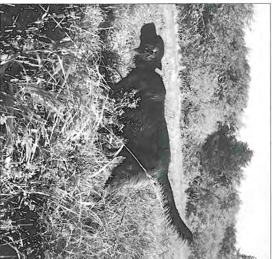
Sprinter u/Per Pedersen.