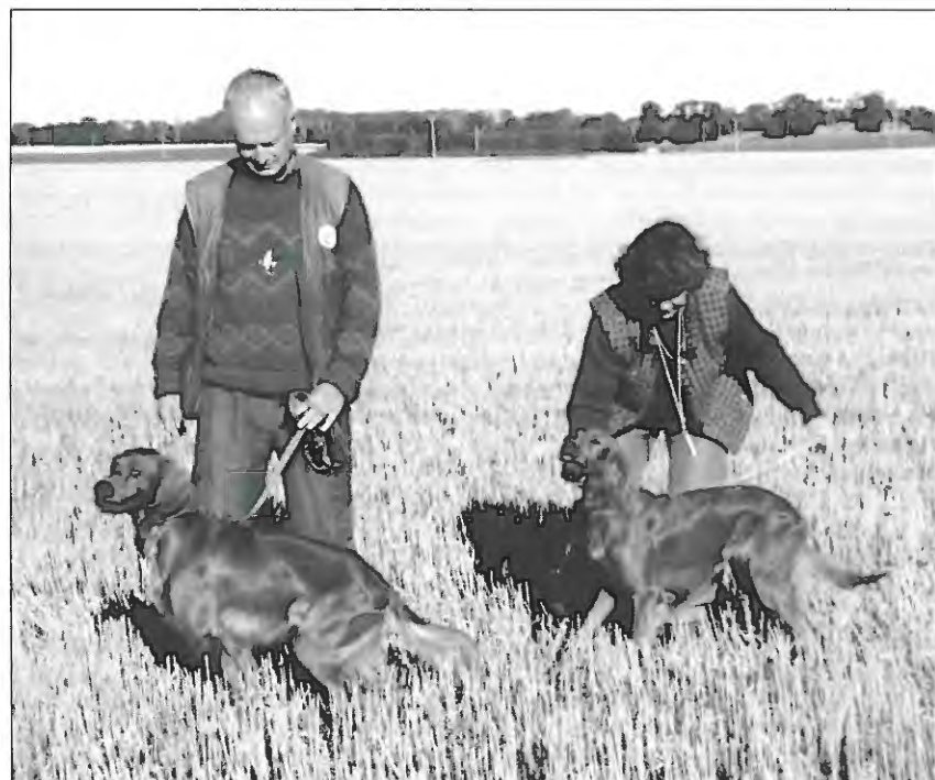
Sheantullagh Glen og Dana.

Sheantullagh Glenn , 03659/2002. født 19/5 2001. (Sheantullagh Drill - Red Quill). Opdr.: R O'Dwyer, Irland. Ejer: Torben Reese