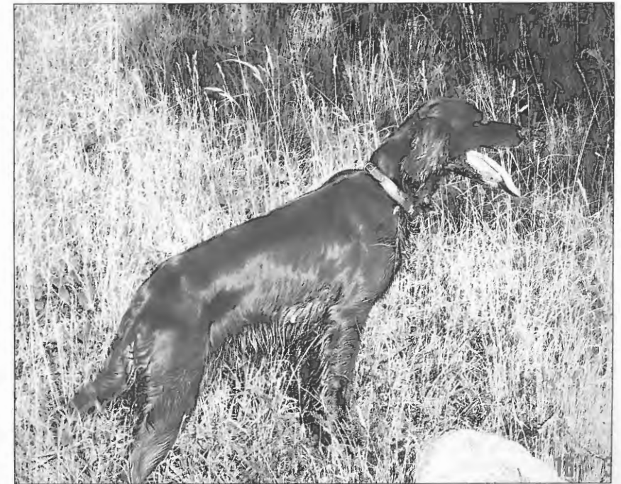
Griffit 1. Vinder.