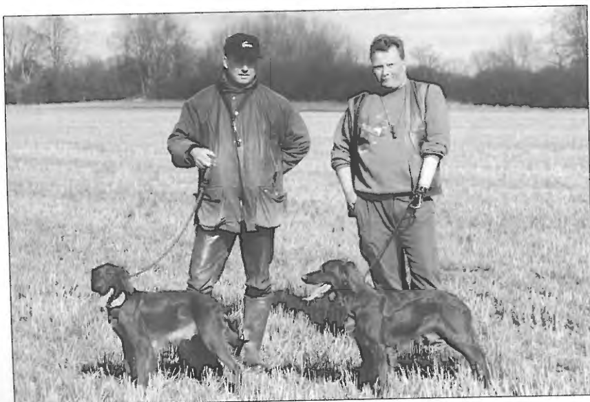
Flanny & Kiwi.

Rex startar mot Chano. Han går i en långsträckt galopp i hög fart men med lite lågt huvud. Söker i sidvind, söket kunde varit mer regelbundet. Stånd utan chans på resning. Lugn i flog och skott. Han tar senare ett resultatlöst stånd. I andra släpp går Rex bra, han har ytterligare ett resultatlöst stånd. Rex rangeras som nr 3.