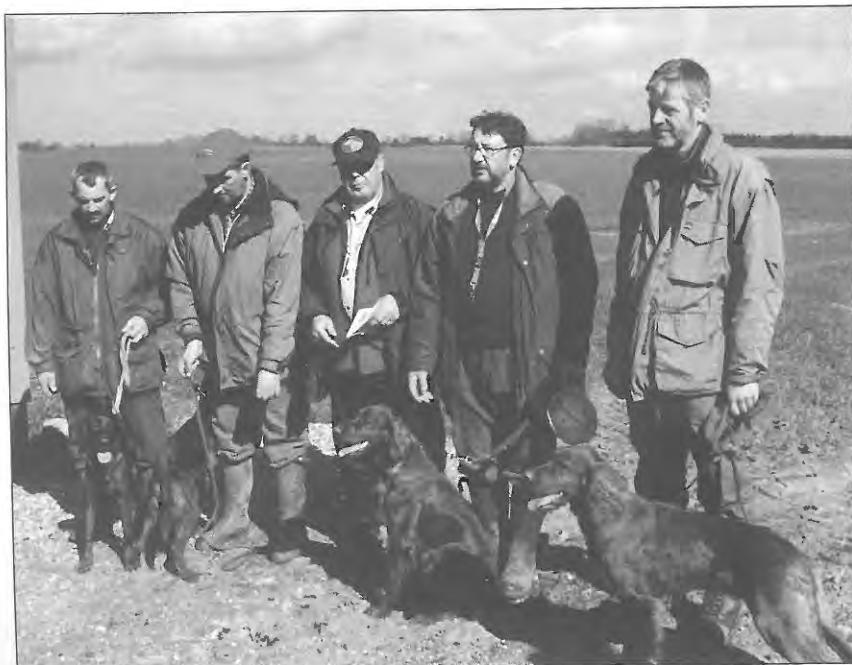
UKK. 1. Rosendales Frida 2. Rosendals Ditte 3. Klippeøens C. Chita 4. Klippeøens C. Sill.

Klippeøens C. Tjako slippes på græs og opharvet græs, fremviser et stort og for det meste et godt og veldækkende søg. Farten god. Stilen god med hovedføring i skulderhøjde og derover. Pæn haleføring og god galopaktion. Har flere markeringer, men udløser selv. Stand for fasan. Rejser godt. Tilpas ro i opflugt og skud. Er lydlig.