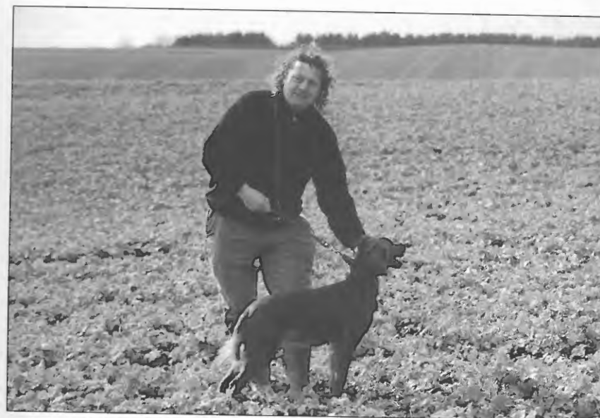
1. Vinder Klippeøens Beth med Bornholmeren.

En hund af stort format med et godt søgsoplæg. Han har en flot fugletagning med fra formiddagen, men præsterer ikke fugl i eftermiddagens afprøvning.