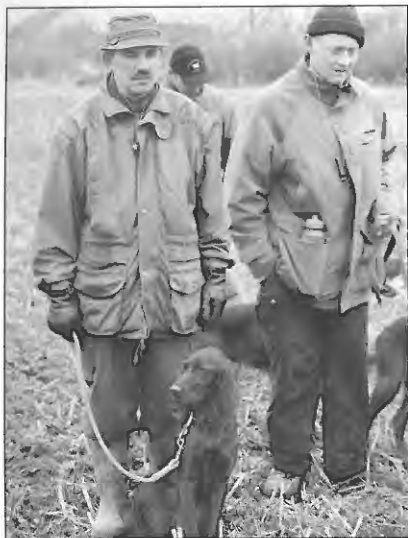
Rosendals Frida, er tilfreds med føreren!!

Rosendals Frida starter i rapsmark. Hun viser et godt stort søg. Udnytter vind og terræn flot, farten er høj med en let og smidig galopaktion. Flot stil med høj hovedføring og svip i halen.