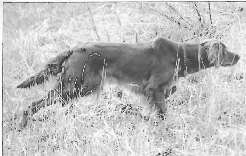
Douedal's Kyra, finnen med de danske aner.

Freja afprøves på raps, hvor hun går i et planløst søg, som præges af stik frem i terrænet. Hun har mange markeringer og stop, hvor hun roder på jordfært. Når Freja strækker ud, er fart, galop og stil i orden. Hun er meget ulydig og vanskelig at stoppe ved partnerens stand. Ved indkaldelse til kobling er hun igen ulydig og søger ind i skov, hvor hun følger råvildt.