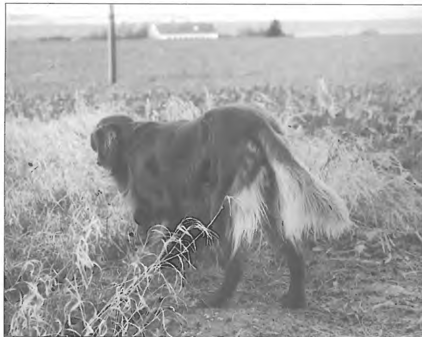
Sheantullagh Glenn 4. Vinder

Marki er en hund af meget stort format, med et prima søgsoplæg. Han havde en fejlfri formiddag, med en god fugletagning, men det lykkedes