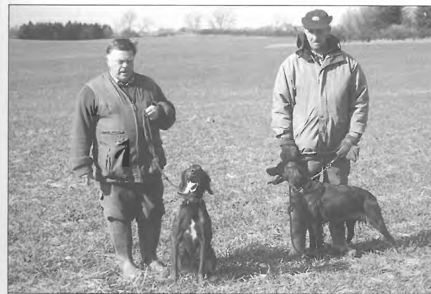
Ibber & Trolla.

Begge starter stort og bredt på marken. Kiwi går noget offensivt. Flanny kaldes smukt under vind og får hjørnet af marken med, hvor hun opnår stand. Hun holder standen længe. Hun avancerer villigt på ordre og rejser