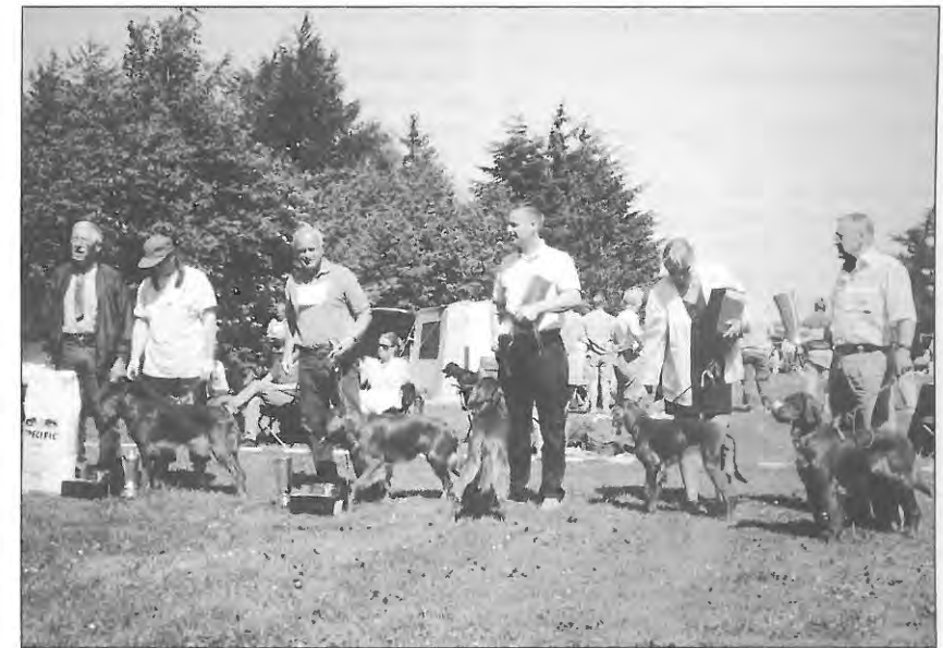
Vinderne fra Årslev.

En brugshundeklasse han med gan- ske god fylde og med et ædelt velskåret hoved. Pæne velansatte øren god stærk hals og ryglinie. God stærk ryg og god brystdybde. Lidt lang hale som dog bæres godt. Gode stærke for og baglemmer med gode