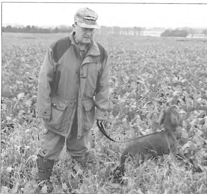
Englyst Canel med formanden.