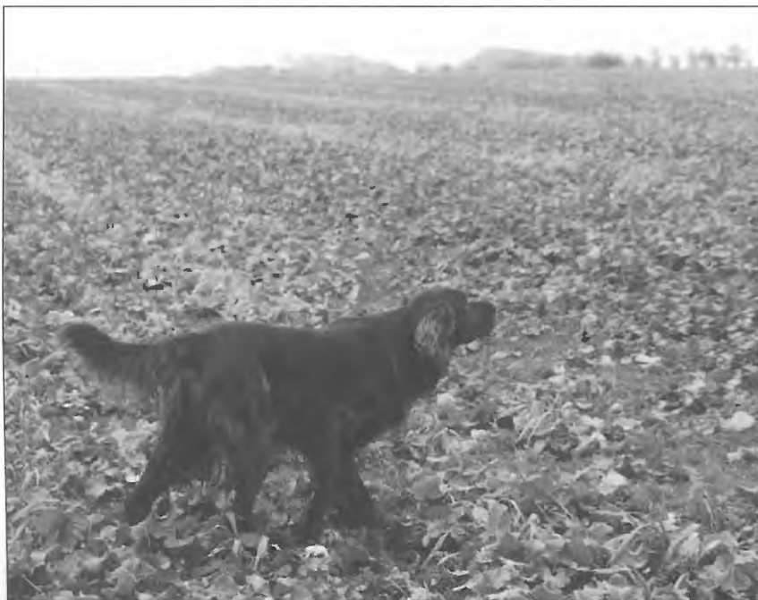
4. Vinder Sprinter.

På mine meddommeres og egne vegne vil jeg gerne takke Dansk Kennel Klub for invitationen til, at dømme på jeres vinderklasse ved Nørager.