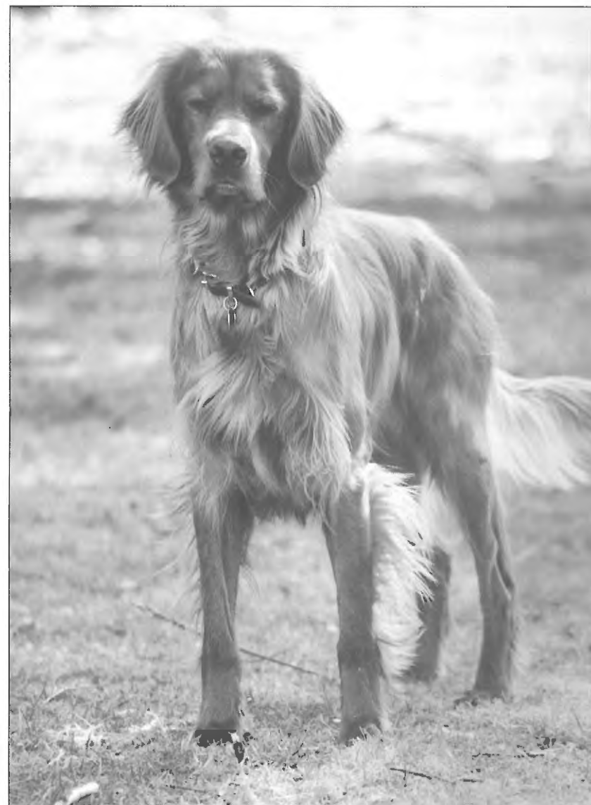
Sheantullagh Glenn v/Torben Reese