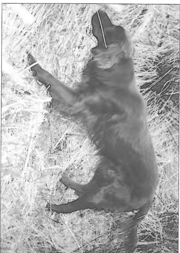
Mårup Skot v/ Ulrik Kjærsgaard