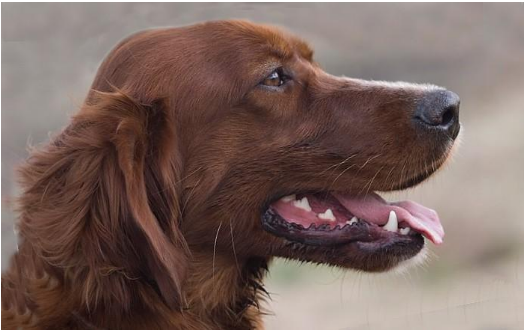
IS Vilslev Josefine - 1465/2008 Flemming Vilslev

Kokus slippes på vintersæd. Hun anlægger et stort, men ganske velanlagt søg. I perioder dog noget offensivt. Farten er god. Stilen er god med en lang flydende galopakktion. Hovedet føres i skulderhøjde og der er let halerørelse. 2.slip på stub. Her søger Kokus stort, men ganske arealdækkende i god fart og stil. Makker opnår stand. Kokus kommer til og fasaner flygter ret foran makker. Kokus er noget urolig da de flygter. Kokus kan i slippet holdes for springende råvildt. Ingen præmie ÅK