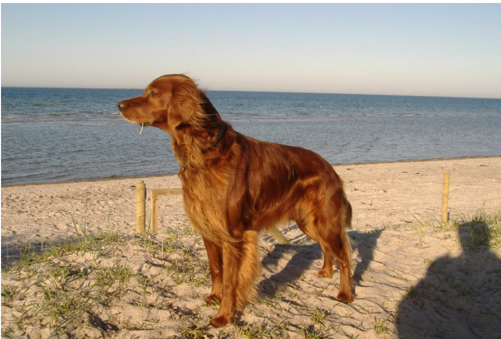
IS Dona - 01563/2004 Torben Reese